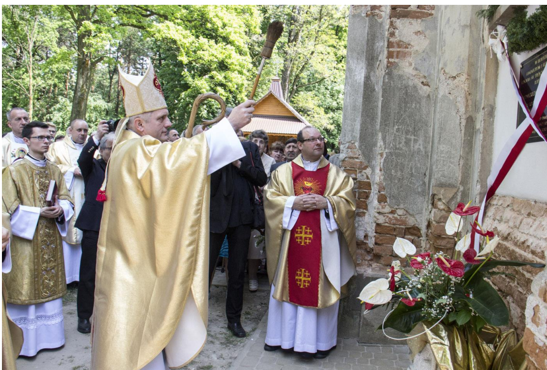
Obchody 150 – lecia konsekracji kościoła pw. Św. Trójcy w Kosienicach (tzw. „kościół w lesie”).