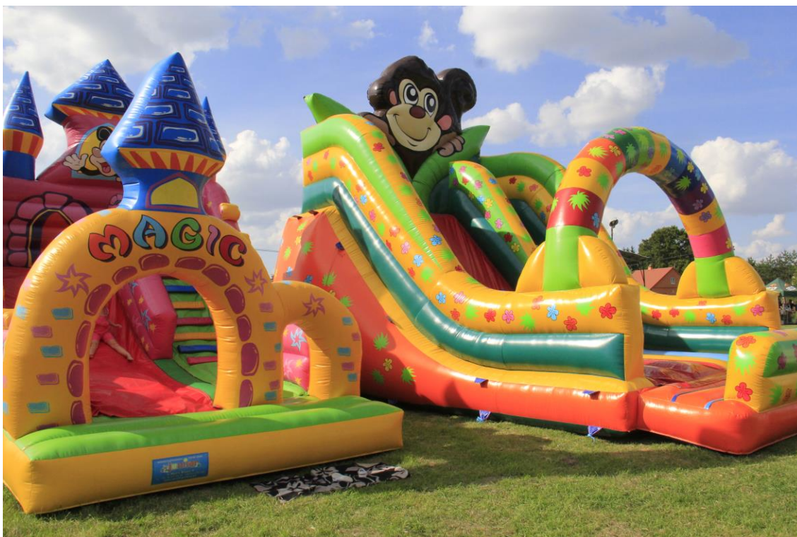
Festyn w Kosienicach