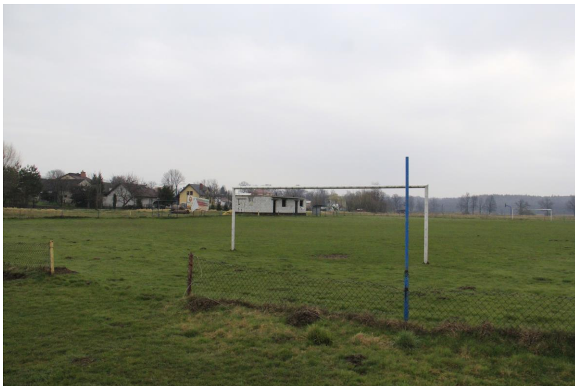
Stadion LKS Tęcza Kosienice