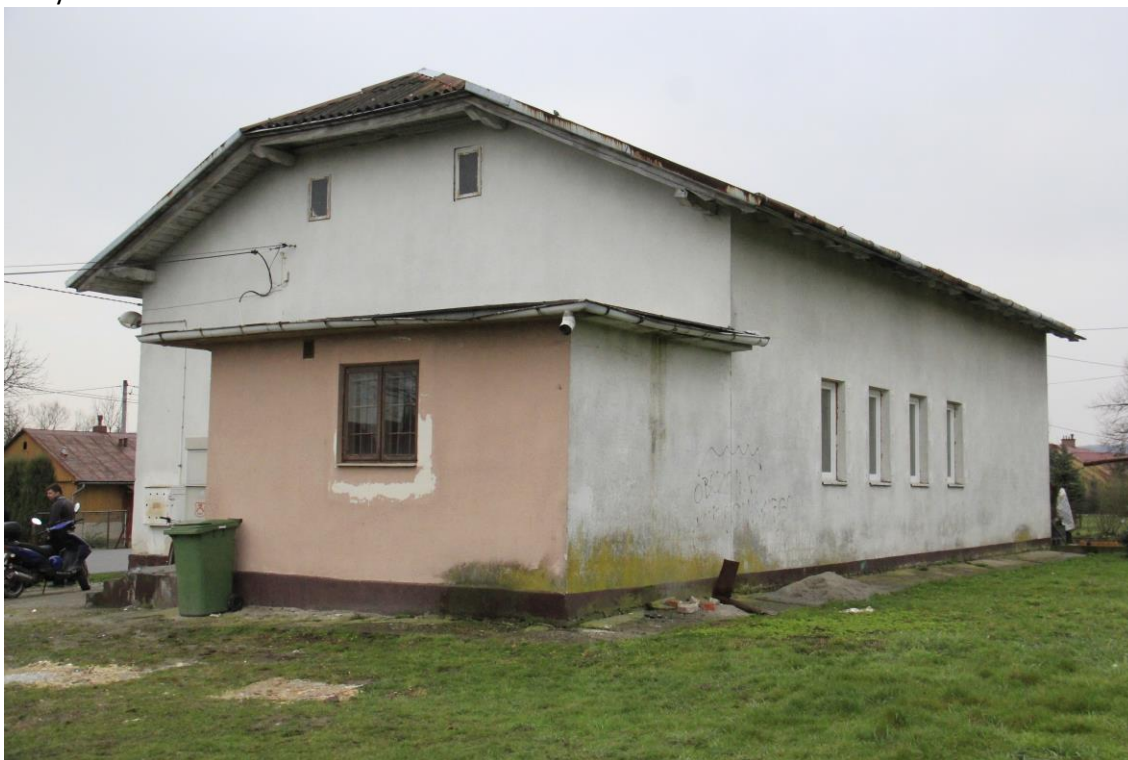
Dom Ludowy w Kosienicach