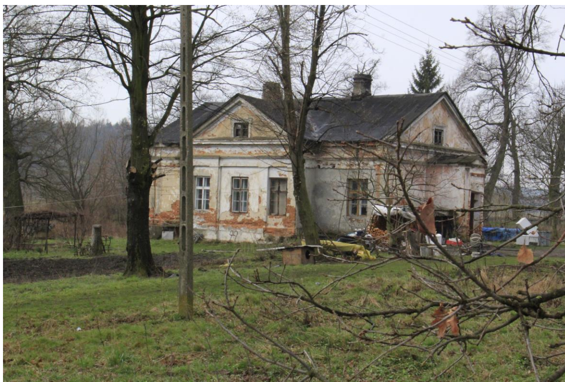
Zespół dworsko-parkowy w Kosienicach