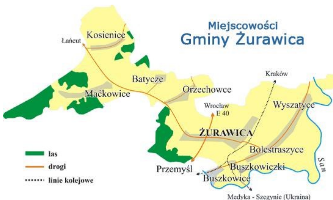
Rys. 1. Gmina Żurawica: Źródło: opracowanie własne

Powierzchnia Gminy wynosi 9575 ha. Zamieszkuje ją 12 930 mieszkańców (według danych na koniec 2014 r.), co powoduje, że gęstość zaludnienia wynosi 128 mieszkańców na km 2 . Podstawową funkcją Gminy jest rolnictwo, funkcje uzupełniające to turystyka i wypoczynek. Wybór tych funkcji spowodowany jest położeniem geograficznym i ukształtowaniem terenu.