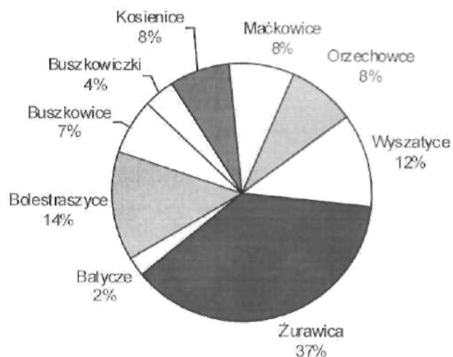
Wykres:2 Struktura ludności według miejsca zamieszkania

Źródło: Urząd Gminy Żurawica, stan na dzień 31.12.2008 r.