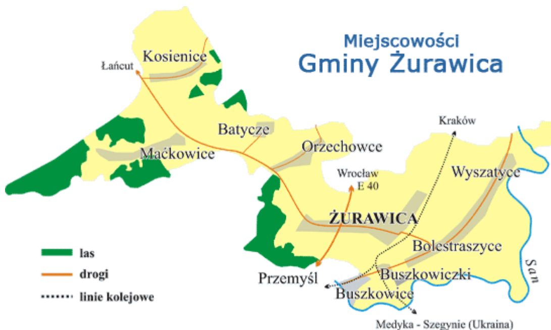
Rys. 1. Gmina Żurawica: Źródło: opracowanie własne

Powierzchnia Gminy wynosi 9575 ha. Zamieszkuje ją 12 930 mieszkańców (według danych na koniec 2014 r.), co powoduje, że gęstość zaludnienia wynosi 128 mieszkańców na km 2 . Podstawową funkcją Gminy jest rolnictwo, funkcje uzupełniające to turystyka i wypoczynek. Wybór tych funkcji spowodowany jest położeniem geograficznym i ukształtowaniem terenu.