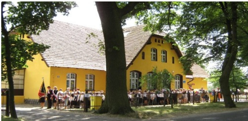
Ryc. 6 Szkoła Powszechna w Grzybowie; obecnie Zespół Szkół Społecznych.

Miejscowość leży przy drodze łączącej Wrześnię z Witkowem na Szlaku Piastowskim. Szlak ten jest istotny ze względu na znaczenie historyczne miejsc na nim położonych (tędy bowiem wędrówki odbywali władcy piastowscy, przemieszczając się między 4 grodami o funkcjach stołecznych) oraz swą popularność (wycieczki wzdłuż jego trasy odbywały się już w latach 60. XX w., a szczególnej wagi nabrał w 1000. rocznicę budowy Państwa Polskiego).