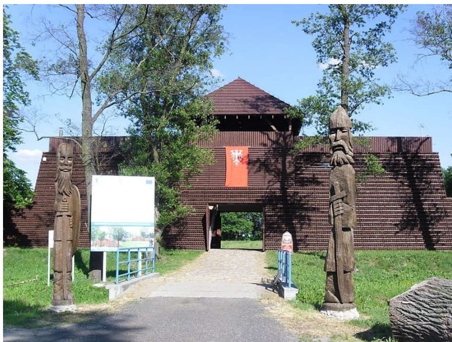
Ryc. 2 Brama wejściowa grodu w Grzybowie

drewna i 84 tys m 3 ziemi. Znajduje się ono obecnie na lewym brzegu rzeki, w odległości ok. 400 m na wschód od dworu i zajmuje powierzchnię 4,7 ha. Archeolodzy znaleźli tu m.in. fragmenty glinianych naczyń, ceramikę, przedmioty z kości, poroża czy żelazne. W 1999 r. znaleziono tu również elementy skarbu odkrytego już wcześniej, tzn. ok. 800 monet – dirhemów oraz pocięte ozdoby ze srebra. Wpisano je do rejestru zabytków pod numerem 1746/A z 5 III 1976 r. (przepisane do księgi C pod numerem 57/Wlkp/c 20.06.2007). Od 1997 r. grodzisko wchodzi w skład Muzeum Pierwszych Piastów na Lednicy jako Oddział Rezerwat Archeologiczny – Gród w Grzybowie, które organizuje tam wystawę stałą pt. „Gród Grzybowo – między plemieniem a państwem”. Z kolei od 2001 r. funkcjonuje Towarzystwo Przyjaciół Grodu w Grzybowie.