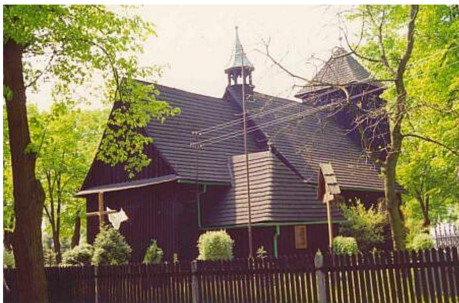
Ryc. 5 Kościół św. Michała Archanioła w Grzybowie