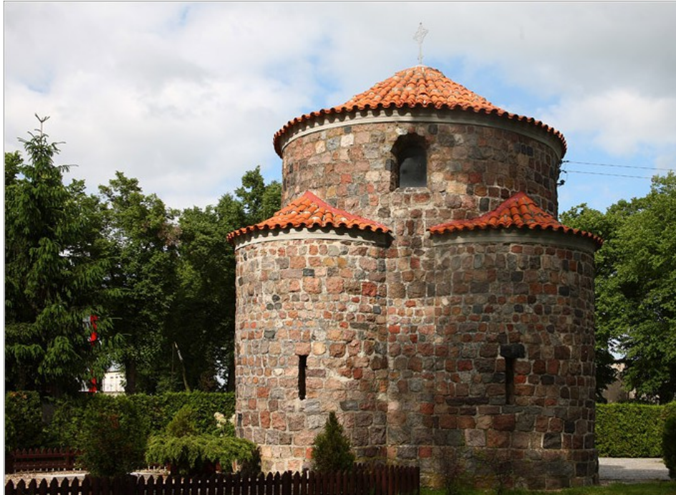
Ryc. 4 Kaplica cmentarna w Grzybowie.

z 1805 r., obraz Matki Boskiej z XVI w. oraz 2 dzwony (z 1549 r. i 1699 r., przeniesione z różnych kościołów). Przed budynkiem ustawiono rzeźbę Matki Boskiej Fatimskiej. Wpisany do rejestru zabytków pod numerem 2465/A z 14.03.1933 roku.