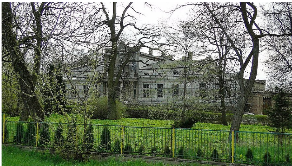
Ryc. 3 Zespół dworski w Grzybowie

prywatną. Dwór otacza park o powierzchni 0,9 ha. Zespół dworski wpisano do rejestru zabytków pod numerem 2200/A z 28. 09. 1990 roku.