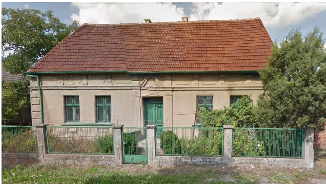
Ryc. 3 Dom nr 22 w Słomowie.