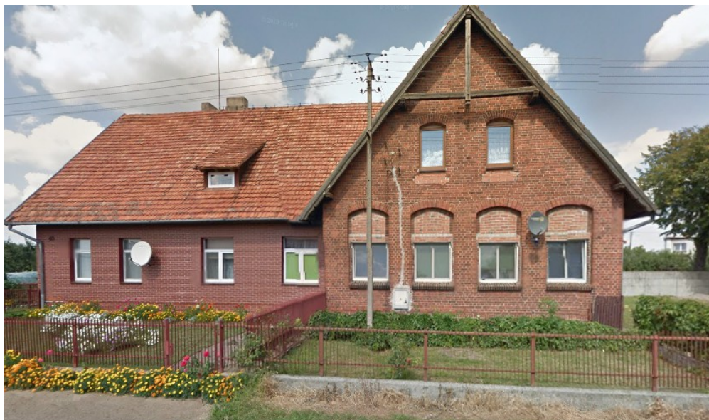
Ryc. 4 Budynek dawnej szkoły podstawowej w Słomowie.

Gimnazjum nr 3 im. Noblistów Polskich w Nowym Folwarku bądź Gimnazjum z Oddziałami Przystosowanymi do Pracy we Wrześni.