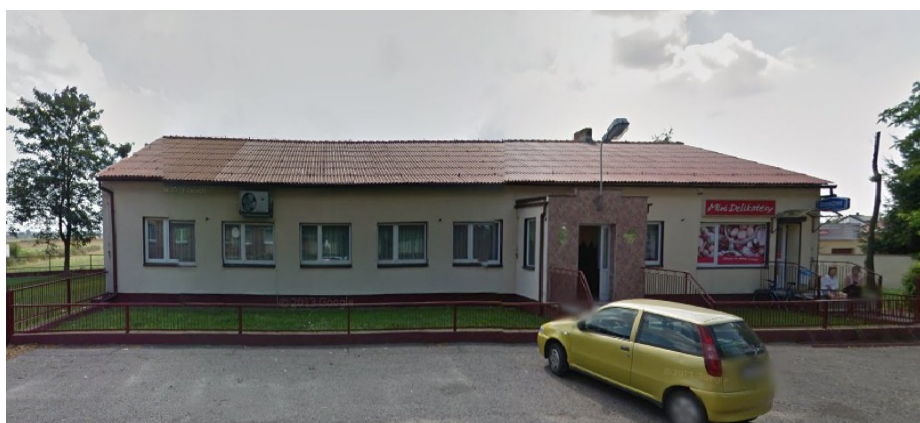
Ryc. 5 Wiejski Dom Kultury w Słomowie.

W 1986 r. otwarto tu Wiejski Dom Kultury, w którym obecnie organizowane są m.in. zebrania wiejskie.