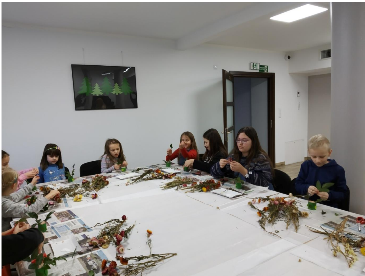
Ferie w Mieście. Warsztaty rękodzieła.