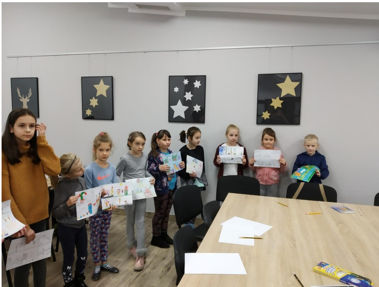
Ferie w Mieście. Prace plastyczne.

Przeprowadzono dwie lekcje biblioteczne dla uczniów klasy II Szkoły Podstawowej w Radymnie. Tematami spotkań były praca biblioteki, jej funkcjonowanie, rola i zadania. Dzieci zapoznały się z rodzajami księgozbioru bibliotecznego, katalogami, zasadami korzystania z biblioteki oraz wypożyczania książek.