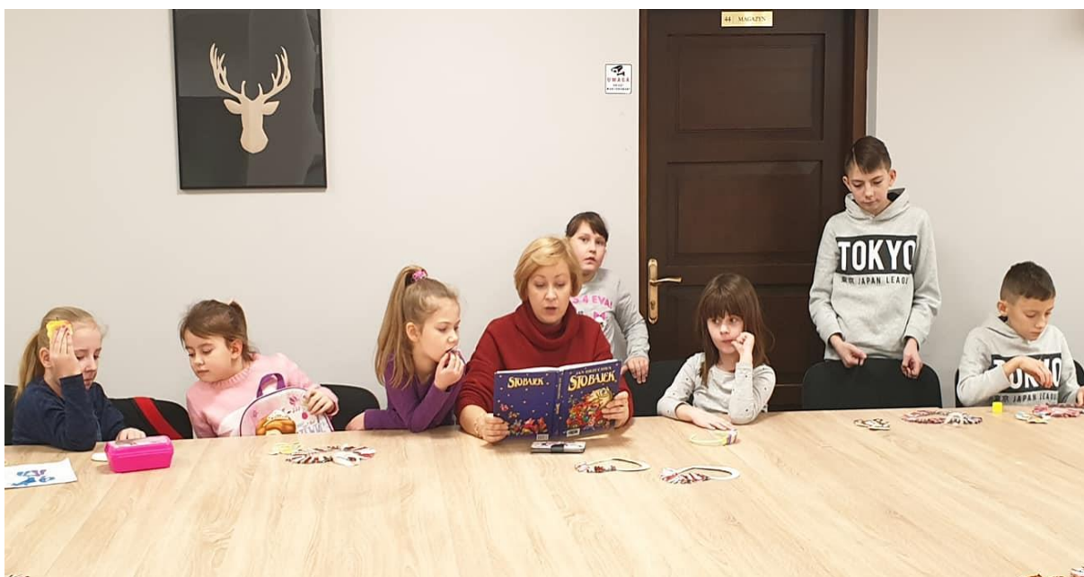
Ferie w Mieście. Zajęcia czytelniczo – edukacyjne. Spotkania z ciekawą książką.