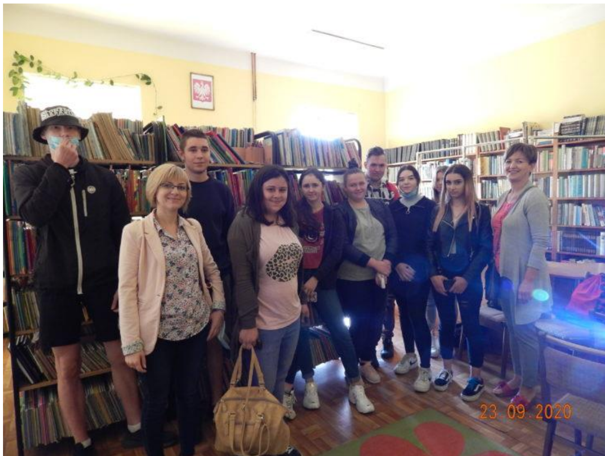
Lekcja biblioteczna dla uczniami z ZSZiR w Radymnie.

Zorganizowano spotkanie edukacyjne dla uczniów z ZSZiR w Radymnie. Uczestników spotkania zapoznano z historią Miejskiej Biblioteki Publicznej w Radymnie, rodzajami gromadzonego księgozbioru, sposobem wyszukiwania materiałów bibliotecznych.