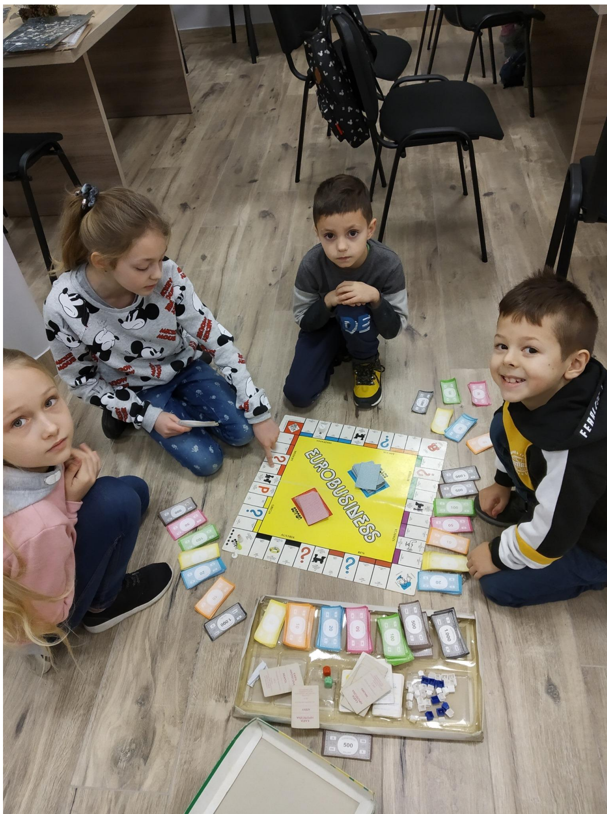
Ferie w Mieście. Gry planszowe.