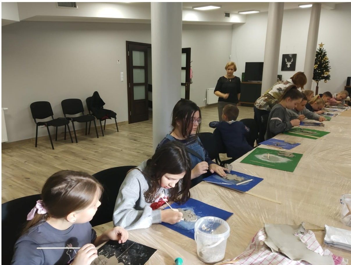
Ferie w Mieście. Zajęcia z rękodzieła. Tworzenie w glinie.