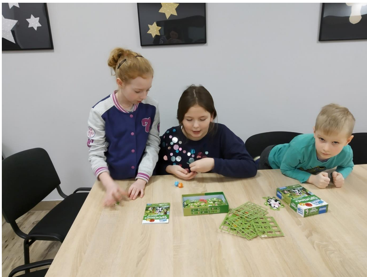
Ferie w Mieście. Gry i zabawy planszowe.