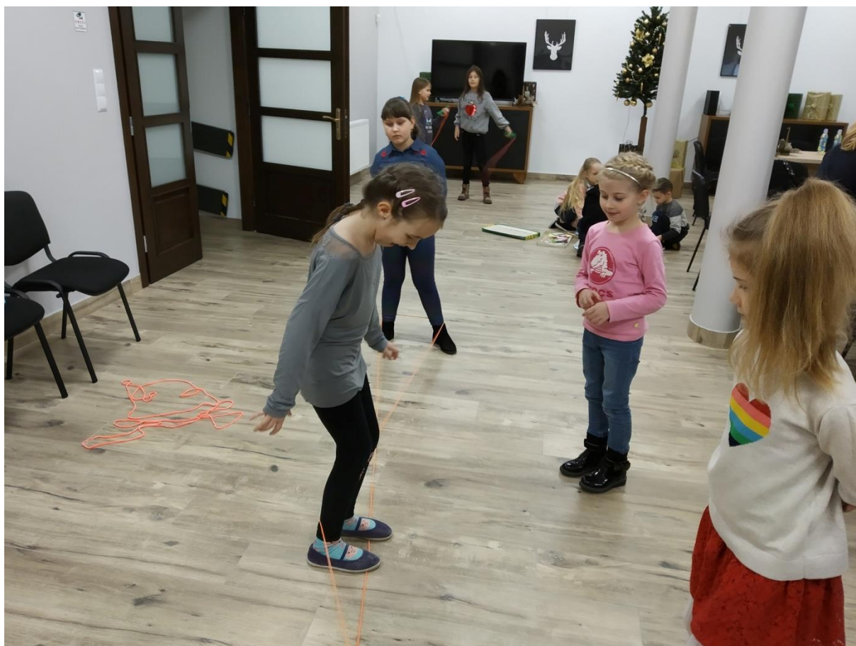
Ferie w Mieście. Gry i zabawy ruchowe.