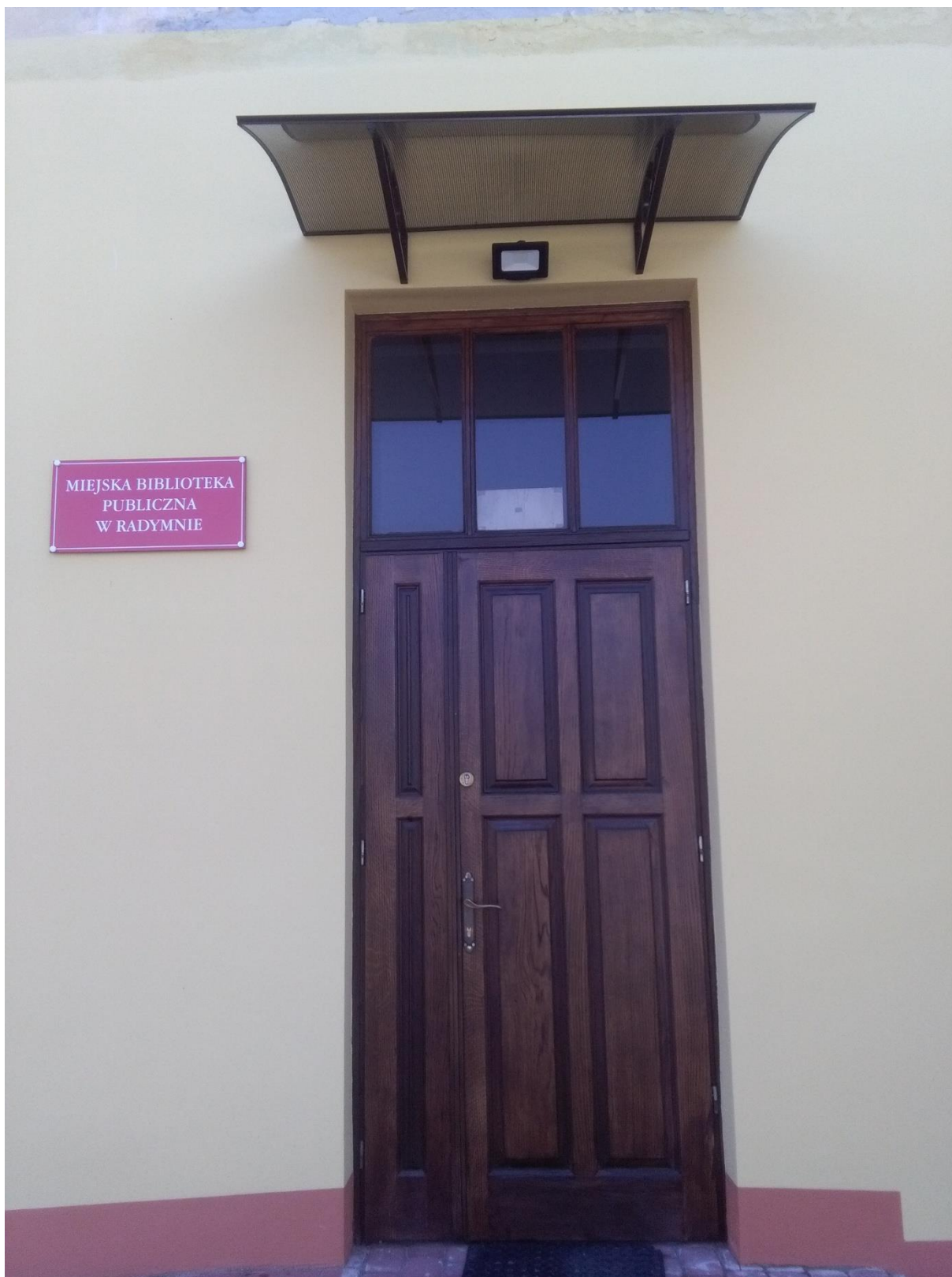
Wejście do budynku Biblioteki.