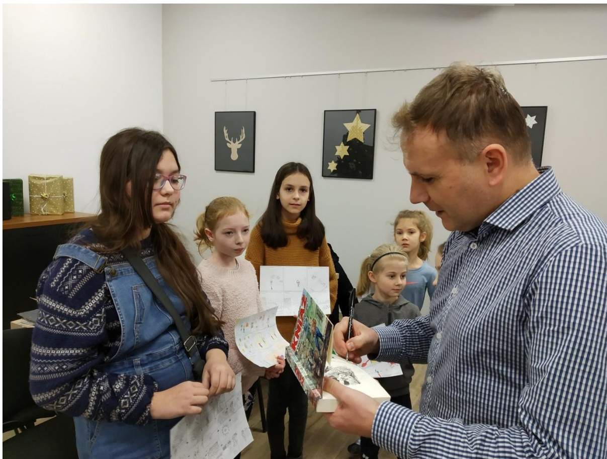
Ferie w Mieście. Warsztaty tworzenia komiksu.