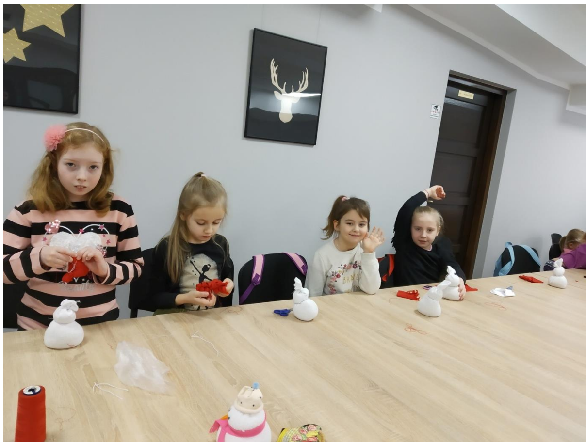
Ferie w Mieście. Warsztaty rękodzieła.