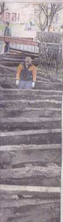
Pracownicy na czas re-

- Jeśli wszystko pójdzie zgodnie z planem, jesienią 2008 r. Czas trwania budowy to ok. półtora roku.