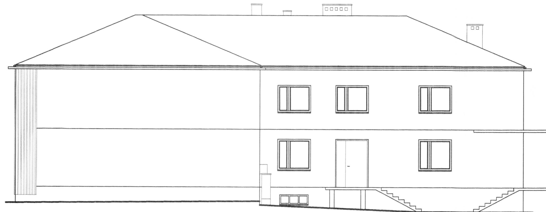
INWENTARYZACJA - ELEWACJA POŁUDNIOWA SKALA 1:100

STAROSTWO POWIATOWE w JAŚLE 38-200 Jasło, Rynek 18 tel./fax (013) 44 834 10