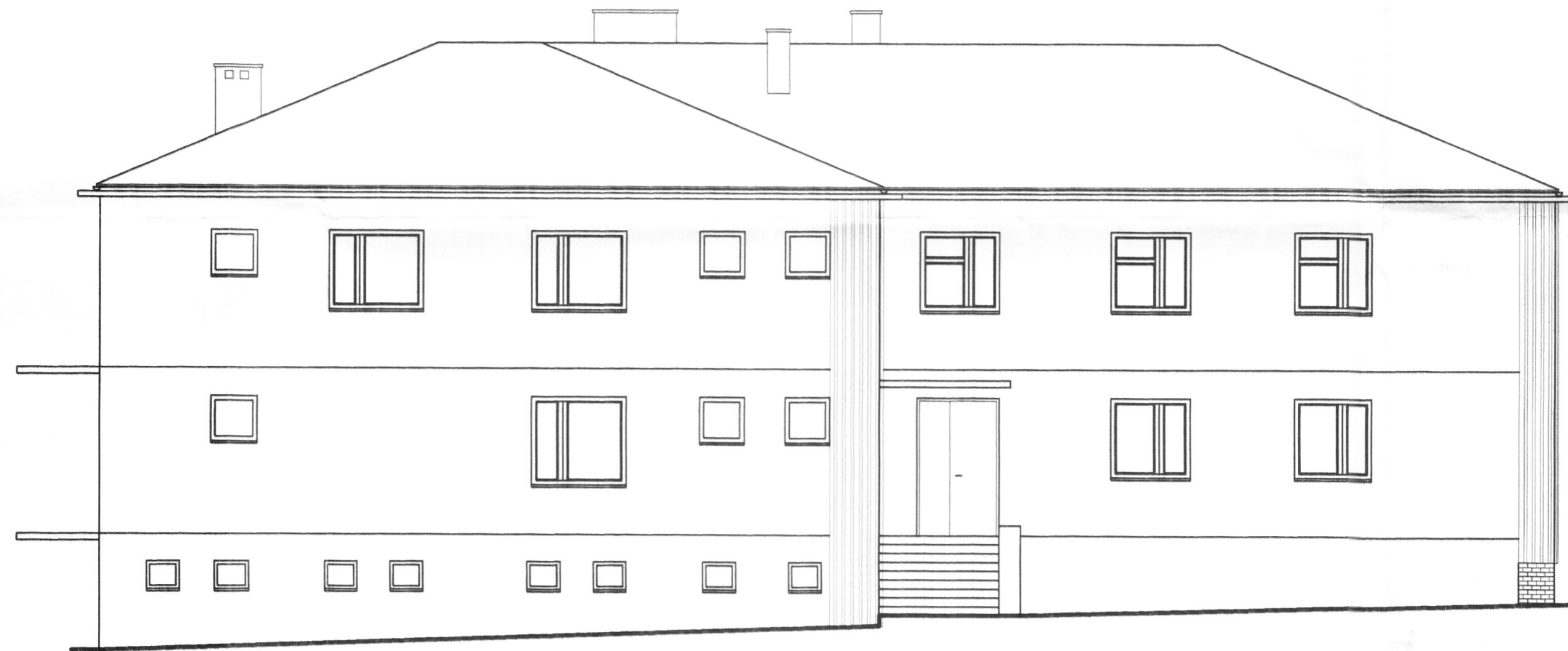
INWENTARYZACJA - ELEWACJA PÓŁNOCNA SKALA 1:100

STAROSTWO POWIATOWE w JAŚLE 38-200 Jasło, Rynek 18 tel./fax (013) 44 834 10