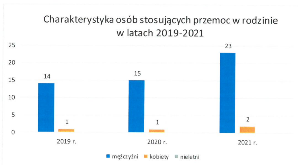
Wykres nr 2: Charakterystyka osób stosujących przemoc w rodzinie w latach 2019-2021

Źródło: Dane Zespołu Interdyscyplinarnego Gminy Nowy Żmigród