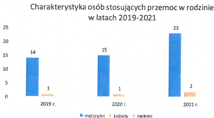
Wykres nr 2: Charakterystyka osób stosujących przemoc w rodzinie w latach 2019-2021

Źródło: Dane Zespołu Interdyscyplinarnego Gminy Nowy Żmigród