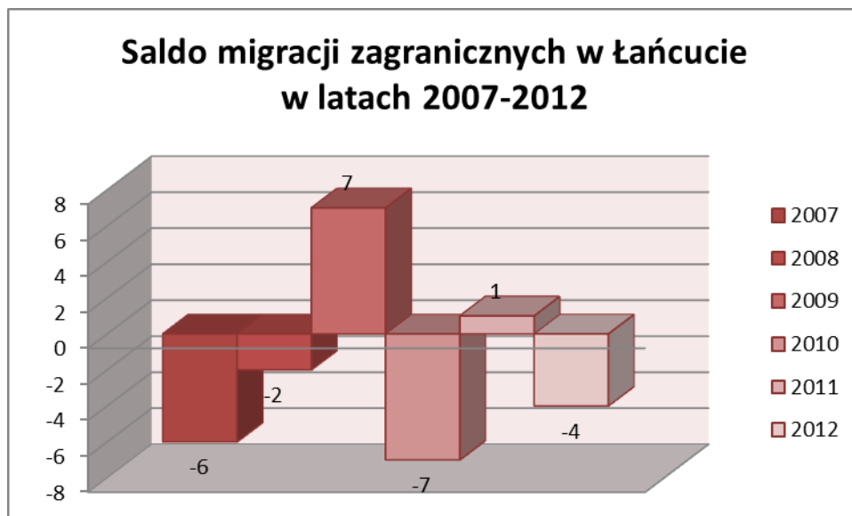
Wykres 4. Saldo migracji zagranicznych w Gminie Miasto Łącut w latach 2007-2012. Opracowanie własne na podstawie danych GUS. Bank Danych Lokalnych.

Poniższy wykres przedstawia saldo migracji zewnętrznych (zagranicznych) w Gminie Miasto Łącut w okresie czasu od 2007 do 2012 roku. Saldo migracji zewnętrznych w analizowanym czasie ulegało wahaniom, przyjmując niewielkie wartości. Największy odpływ ludności za granicę nastąpił w 2007 oraz 2010 roku, natomiast największy napływ ludności z zagranicy wystąpił w 2009 roku.