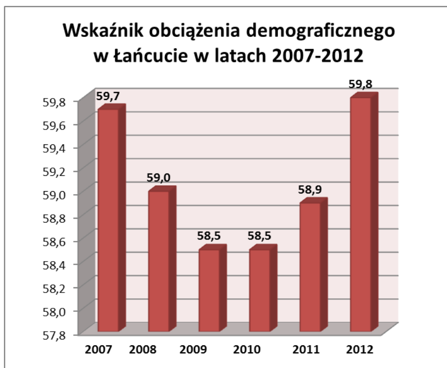
Wykres 2. Wskaźnik obciążenia demograficznego (ludność osób w wieku nieprodukcyjnym na 100 osób w wieku produkcyjnym) w Gminie Miasto Łańcut w latach 2007-2012. Opracowanie własne na podstawie danych GUS. Bank Danych Lokalnych.

Jednym z najczęściej stosowanych mierników zaawansowania procesu starzenia się jest wskaźnik starości, przedstawiający udział osób starszych wśród ogółu populacji. Wartość tego współczynnika w ciągu ostatnich lat systematycznie wzrasta. W 2012 roku współczynnik starości, przedstawiający udział kobiet w wieku 60 lat i więcej oraz mężczyzn w wieku 65 lat i więcej wśród ogółu populacji, w mieście wyniósł 19,2% i był wyższy od współczynnika starości dla powiatu łańcuckiego, wyższy od współczynnika starości obliczonego dla całego województwa podkarpackiego oraz kraju. Innym miernikiem procesu starzenia się ludności jest indeks starości, wyrażający liczbę osób starszych (w wieku poprodukcyjnym) przypadających na 100 osób w wieku przedprodukcyjnym. W 2012 roku wskaźnik ten, obliczony dla ludności w Gminie Miasto Łańcut przyjął wartość 105,6 (dla porównania – powiat łańcucki – 83,8; województwo podkarpackie – 85,9; Polska – 97,1). Starzenie się społeczeństwa wraz ze zmniejszającym się przyrostem naturalnym przyczynia się do powstania problemów: ekonomicznego, finansowego oraz społecznego. Ten niekorzystny trend demograficzny zachodzi w skali ogólnokrajowej, pojawiające się natomiast problemy społeczne powinny być rozwiązywane lokalnie. W Gminie Miasto Łańcut proces ten