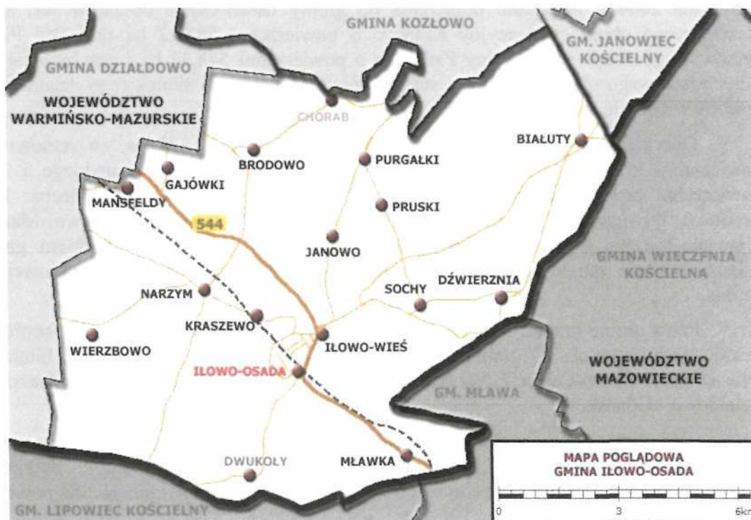
Mapa 1. Gmina Iłowo-Osada