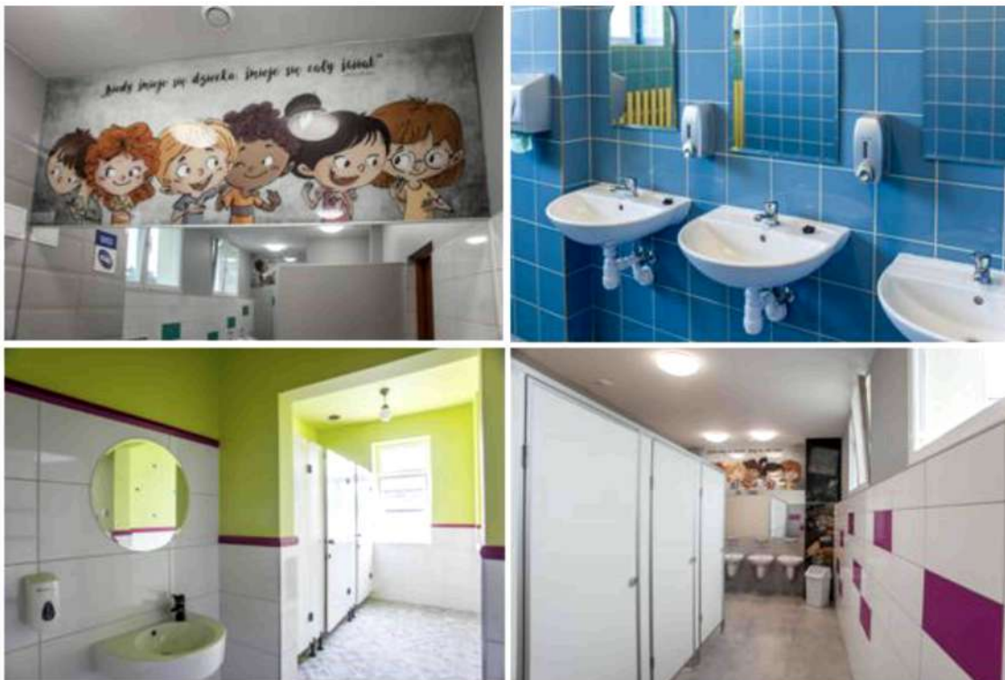
foto. Zdjęcia wyremontowanych łazienek w zwycięskich szkołach 2. edycji programu "Wzorowa Łazienka".