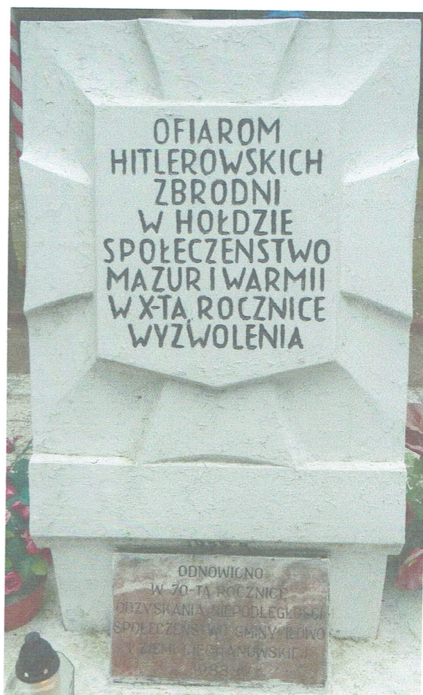
Obecne tablice. Wskazana zmiana ze względu na treść i liternictwo