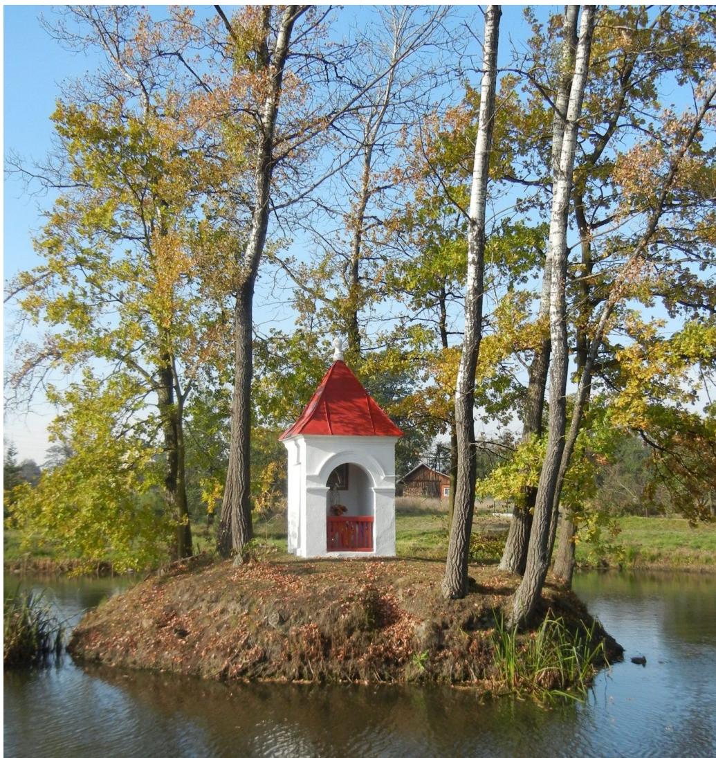
Kapliczka na wyspie na stawie w Krzemienicy

rozpusty pochłonęło zapadlisko, które zalała woda. Z topieli ocalał tylko grajek (wg innej wersji para nowożeńców), który był wtedy w karczmie. Cudem znalazł się on na wyspie na której dzisiaj stoi kapliczka.