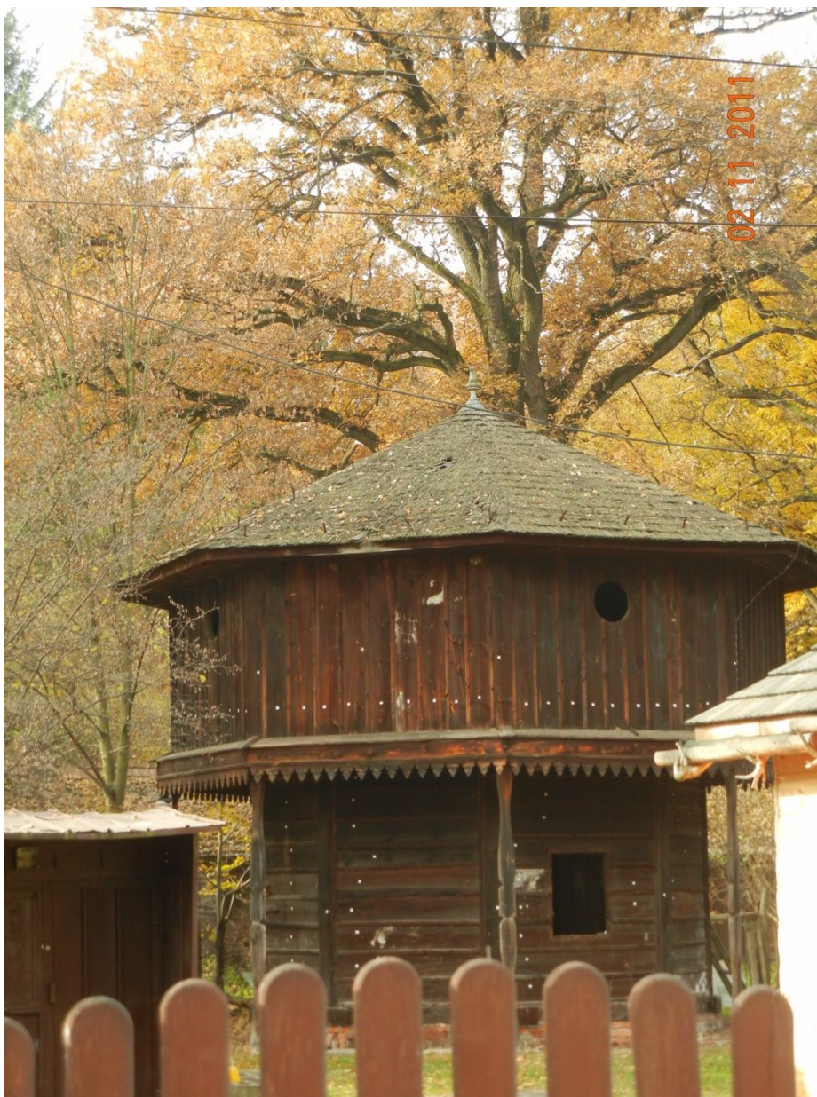
Zespół Budynków Dyrekcji Lasów Ordynacji Łańcuckiej – Dyrekcja Lasów – SUSZARNIA NASION