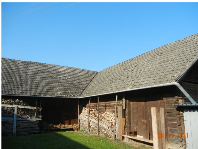
Dawne Gumno – STODOŁA w Woli Małej