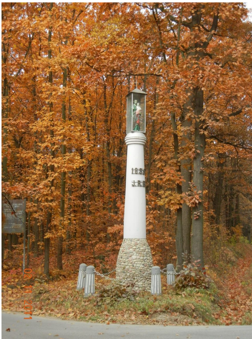
Zespół Budynków Dyrekcji Lasów Ordynacji Łańcuckiej – Dyrekcja Lasów – FIGURA ŚW. JÓZEFA Z DZIECIĄTKIEM