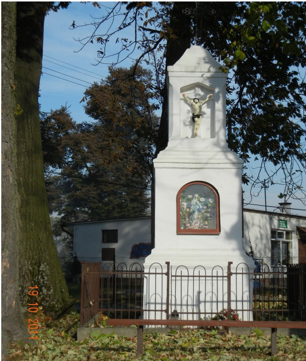
Kapliczka przy granicy z Krzemienicą