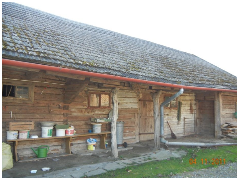
Dawne Gumno – DOM w Woli Małej