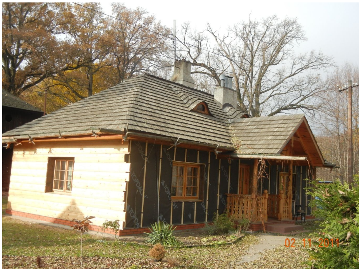
Zespół Budynków Dyrekcji Lasów Ordynacji Łańcuckiej – Dyrekcja Lasów - ADIUNKTÓWKA

Suszarnia nasion - budynek wzniesiony ok. 1860 r., drewniany, kryty gontem. na rzucie ośmioboku foremnego. Obiekt piętrowy, górna kondygnacja nadwieszona, wsparta na ozdobnych słupach. Restaurowana w roku 1970. Suszarnia konstrukcji sumikowo – łątkowej i szkieletowej z nadwieszoną górną kondygnacją. W otoczeniu suszarni znajduje się pozostałość parku z kilkudziesięcioma sędziwymi dębami oraz lipami i okazały platan klonolistny (forma piramidalna).