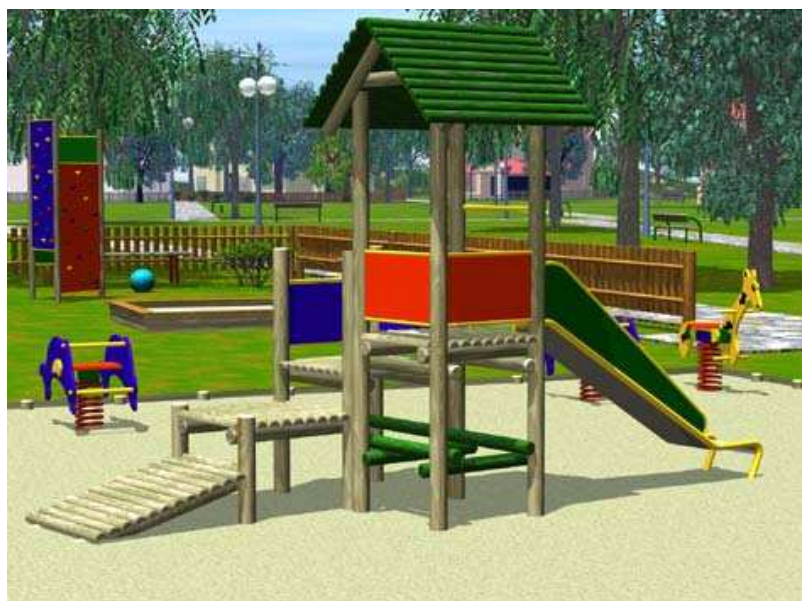
ZESTAW NR 6