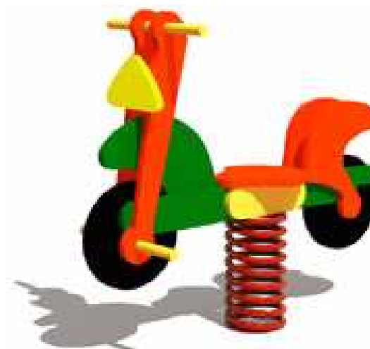
SKUTER NA SPRĘŻYNIE NR 035