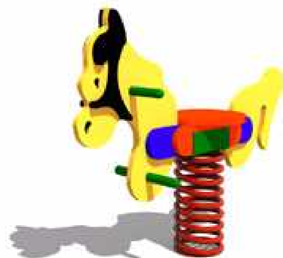
KONIK NA SPRĘŻYNIE NR 032