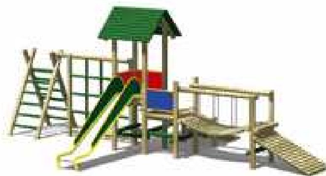
ZESTAW NR 9