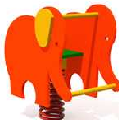
SŁOŃ NA SPRĘŻYNIE NR 0354