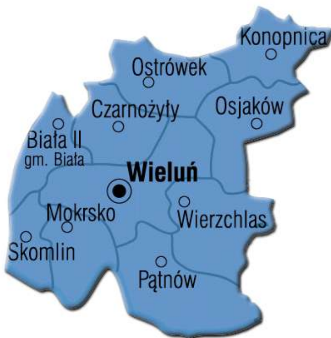
Mapa nr 1: Położenie Gminy Wierzchlas

Obszar miejscowości Kraszkowice położony jest na wyżynie Wieluńskiej – najbardziej na północ wysuniętej części Wyżyny Krakowsko – Częstochowskiej. Charakterystyczne są tu pagórki typu morenowego oraz wzgórza zbudowane z wapieni.