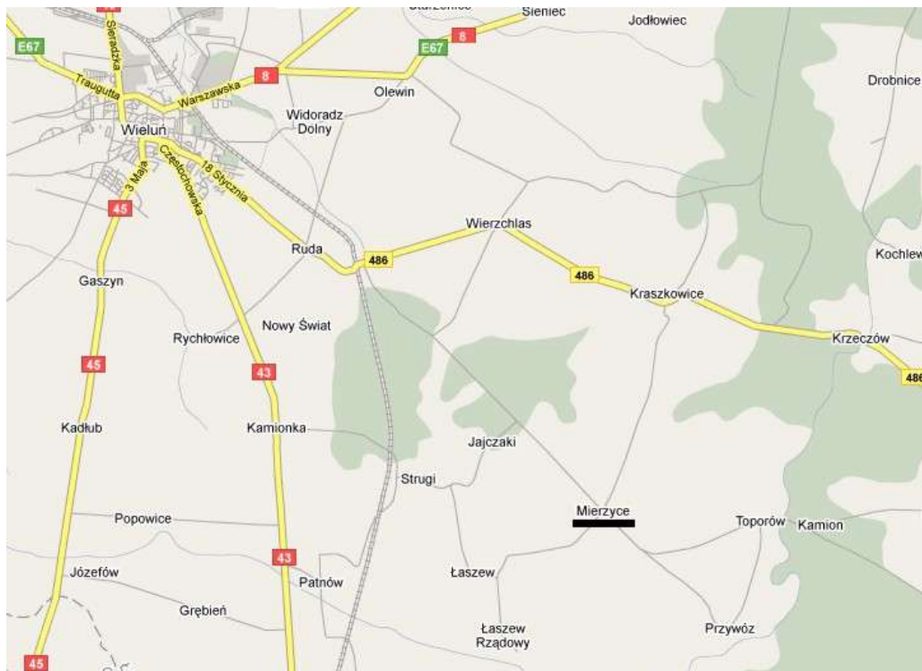
Mapa nr 2: Położenie miejscowości Mierzyce

Miejscowość Mierzyce położona jest w południowo - wschodniej części Gminy Wierzchlas.