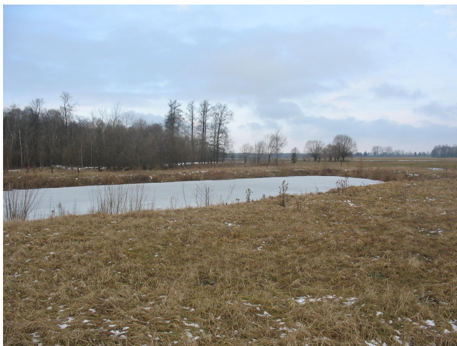
Teren planowanej inwestycji

Koszt całkowity 80 000 zł, w tym środki własne gminy 80 000 zł.