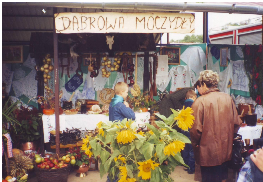
Stoisko Koła Gospodyń Wiejskich na spotkaniu z prezydentem RP

Atrakcją stołu w czasie różnych uroczystości rodzinnych i środowiskowych jest zwykle oryginalne ciasto w formie kolczastego stożka, zwane tutaj sękaczem, a już od ponad ćwierćwiecza wypiekane przez tutejsze gospodynie. Często też stanowi tzw. „gościniec”, wręczany co znamienitszym gościom, uświetniającym uroczystości organizowane nie tylko przez społeczność lokalną. Przepis na to widowiskowe ciasto jest wprawdzie prosty, ale jego wykonanie wymaga sporej wprawy i odpowiednich przyborów, a także ekologicznie czystych składników – dlatego tak trudno wykonać go samodzielnie, co podnosi jego walory smakowe i estetyczne. Poniżej udostępniamy jednak przepis na ten niecodzienny smakołyk.