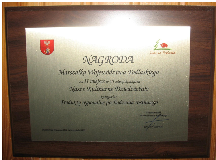
Dyplomy i podziękowania Koła Gospodyń Wiejskich