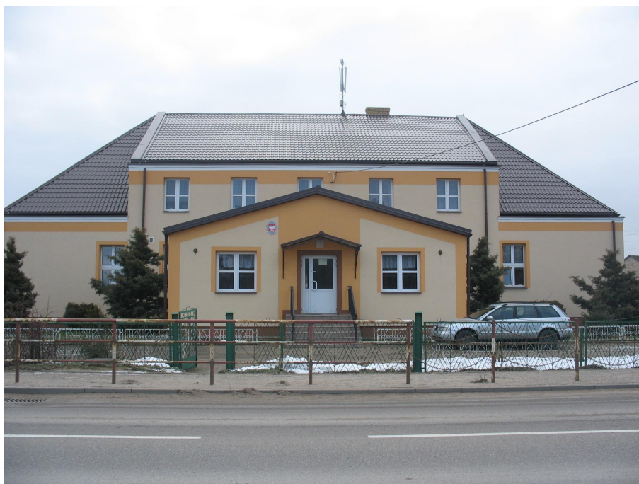
Szkola Podstawowa po remoncie prezentuje się bardzo okazale

oświatowych o „przydział” nauczyciela. Ze względu na dużą liczbę uczniów – ponad 100 – rodzice i nauczyciele dążyli do budowy szkoły z prawdziwego zdarzenia.