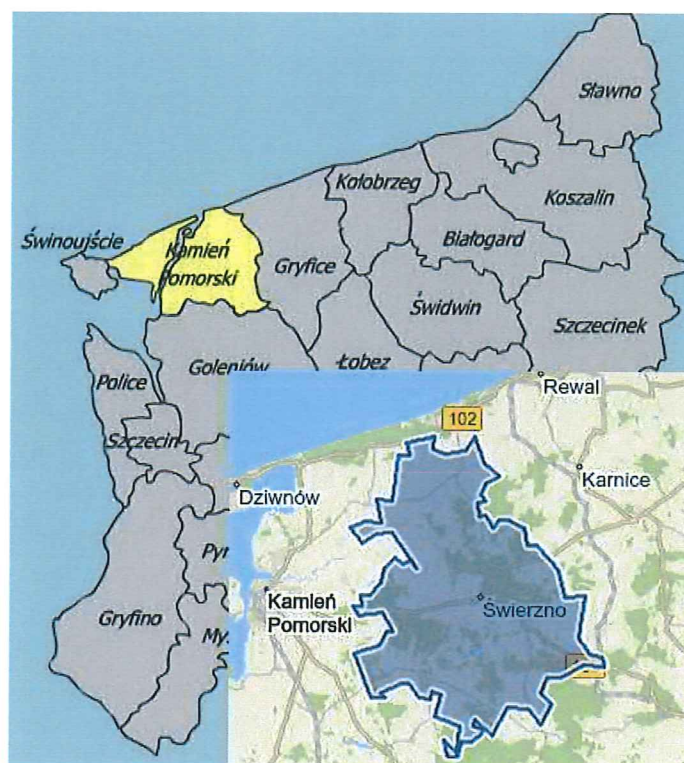
Rysunek 1. Położenie Gminy Świerzno