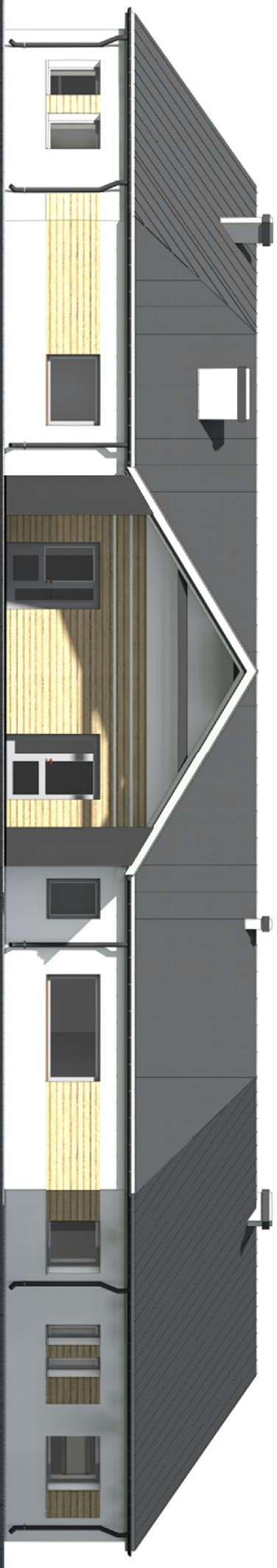
ELEWACJA PÓŁNOCNO-ZACHODNIA - FRONTOWA