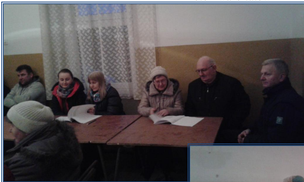
Foto z warsztatów