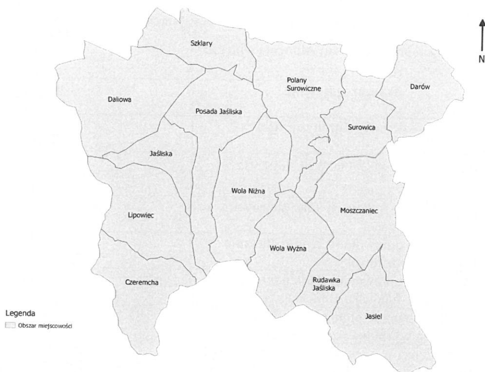
Rycina 2. Podział Gminy Jaśliska na miejscowości