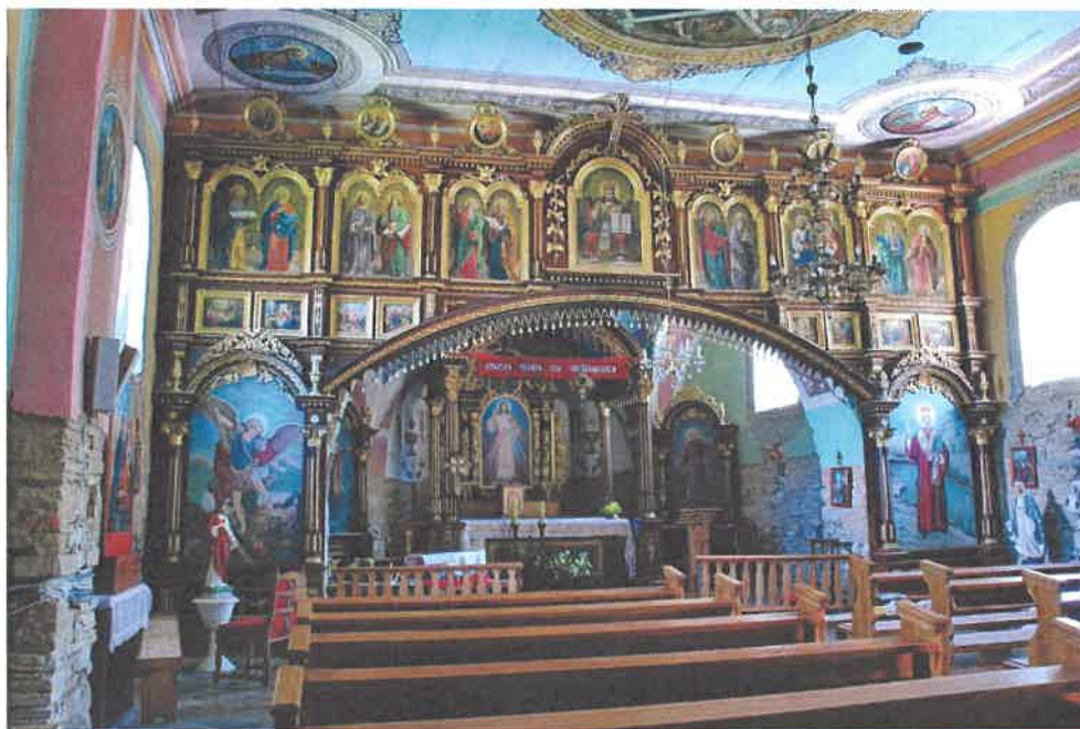
Gmina Jaśliska 20 - 21 kwietnia 2017 r.