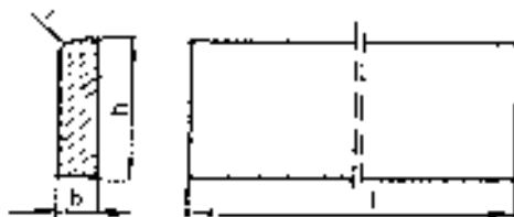
Rysunek 1. Kształt betonowego obrzeża chodnikowego

Kształt obrzeży betonowych przedstawiono na rysunku 1, a wymiary podano w tabelicy 1.